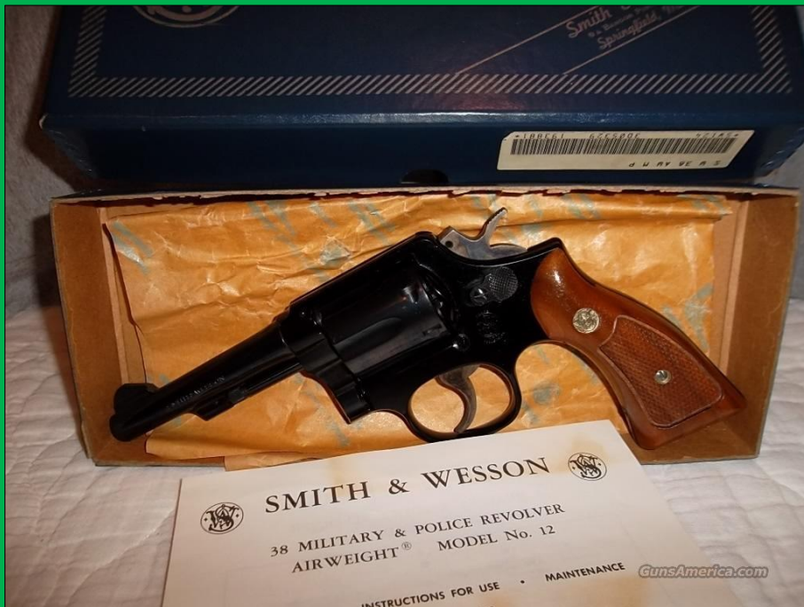
Modell 12 Airweight