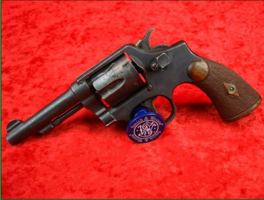
.38 Military and Police Victory Model