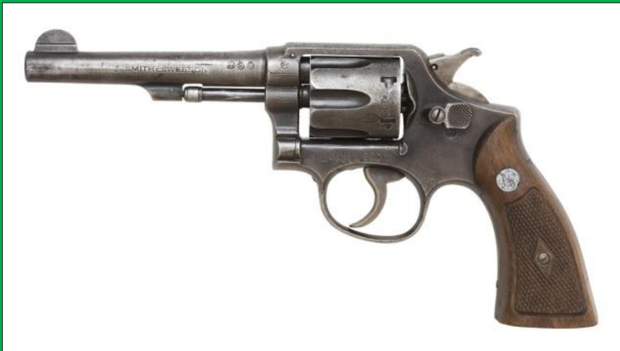
Modell 10 ( .38 spec. )