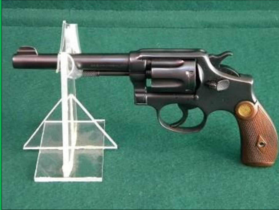
.38 Military and Police Hand Ejector 1 st Model

In den Disziplinen „Dienst-Sportpistole /-revolver“ gem. Nr. K 10 Anhang 2 Kurzwaffenteil können folgende S&W-Modelle eingesetzt werden: