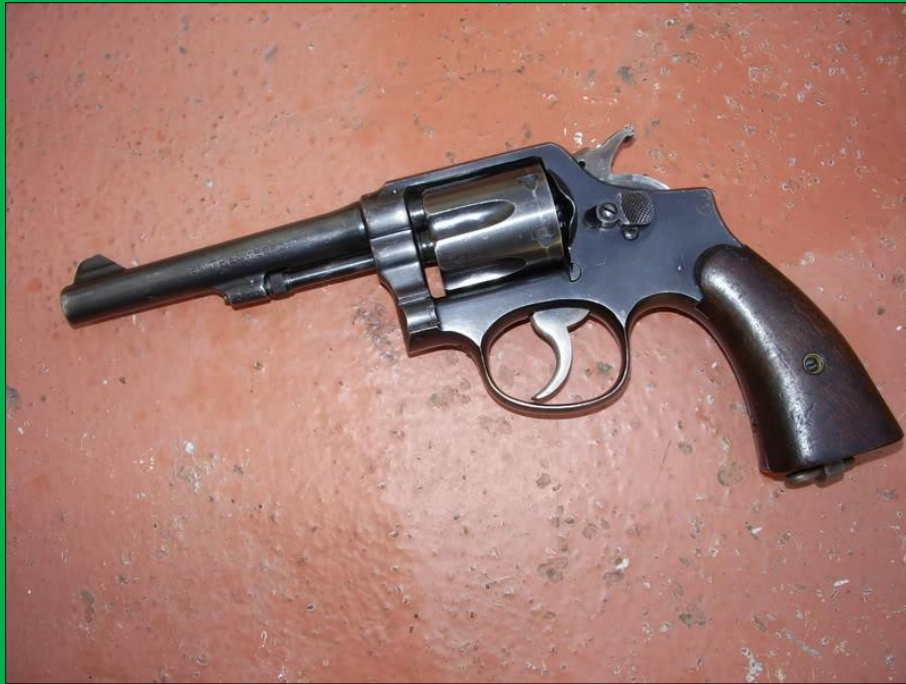
Modell 11( .38 &W )