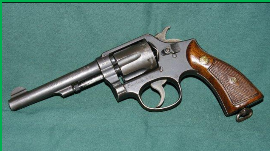
.38 Military and Police Hand British Service Kaliber .38 S&W